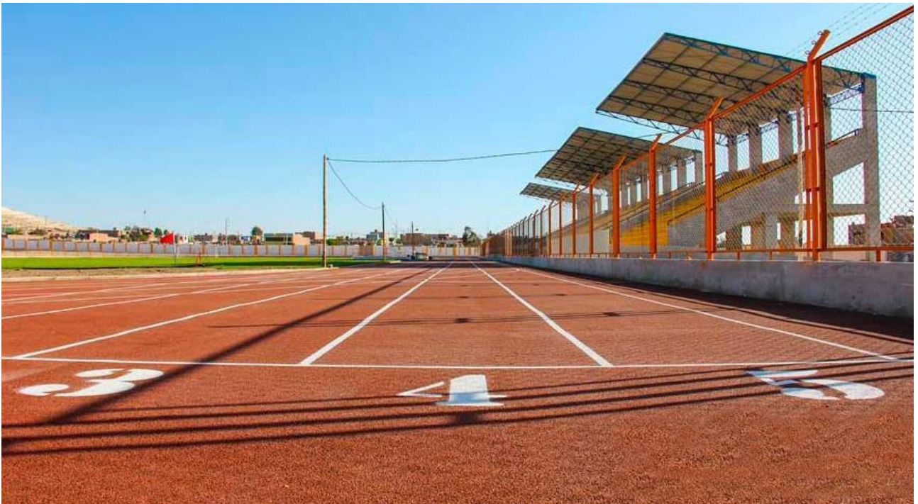
Fig. 07 Pista Atletica Sistema Monocapa Terminada. Pisco

Una vez aplicado el pavimento no debe pisarse, ni mojarse en las siguientes 48 horas, hasta que esté totalmente seco. - No transitar con vehículos pesados por encima de la superficie.