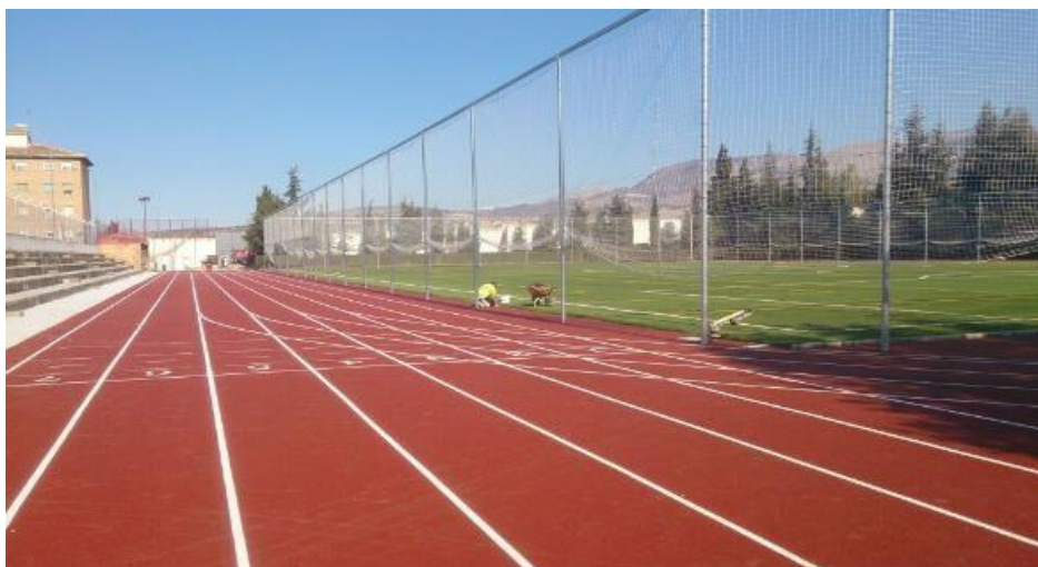
Fig. 04 Pista Atletica Sistema Monocapa Terminada.