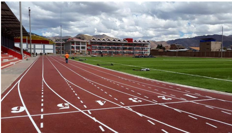
Fig. 05 Pista Atletica Sistema Monocapa Terminada. Cuzco

El uso de cauchos provenientes de desechos sin control sanitario puede ser un riesgo para la salud, en tal sentido nuestros productos están certificados por pruebas de laboratorio independientes. SGS Alemania: No Inflamabilidad, No Carcinogénico, No Corrosivo, No Tóxico por Inhalación, No Peligroso para el Medio Ambiente.