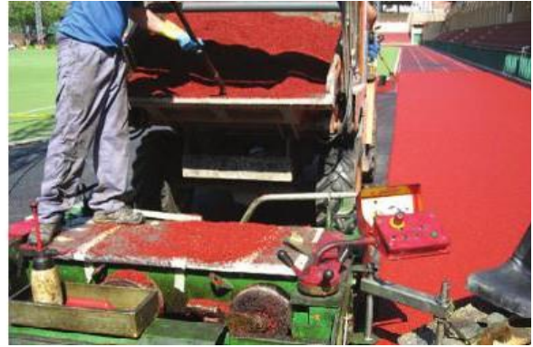
Fig. 03 Proceso de Construcción