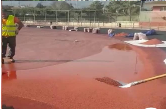
Fig. 02 Proceso de Construcción

Sistema elástico de instalación monocapa in situ. Caucho EPDM en color, ligado con resina de poliuretano sobre base de asfalto u hormigón poroso.